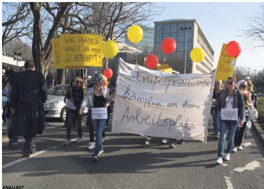
24. März: Die Prostituierten demonstrieren gegen die geplante Schließung des Straßenstrichs.

gemodell.“ Er habe die Suche nach Freiern im dicht bewohnten Viertel rund um den Nordmarkt begrenzt, die Sicherheit der Frauen erhöht sowie Zuhälterei und Kinderprostitution eingedämmt. „Deshalb waren auch die Leiterin des Gesundheitsamtes und sogar die Sozialdezernentin für den Erhalt“, erinnert er.