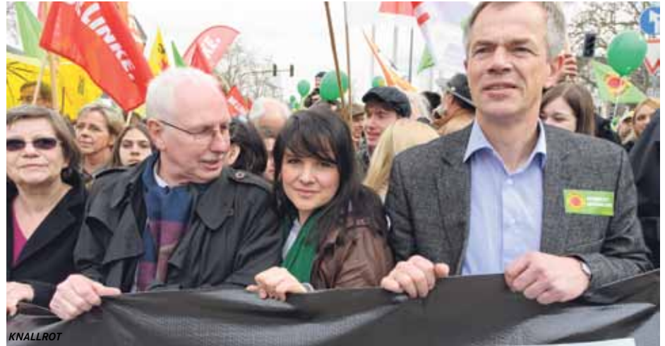
Landtagsabgeordnete der Linken bei der Demonstration in Köln am 26. März 2011