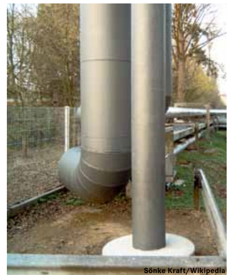
Fernwärmefreileitungen in Hameln

Ebenfalls über den Begleitantrag von DIE LINKE wurde beschlossen, dass die künftige Beteiligungs- und Unternehmensstruktur so anzulegen ist, dass die Stadtwerke als kommunale Tochterunternehmen erhalten bleiben und die demokratische Einflussnahme sichergestellt wird. Die Mitbestimmung der Arbeitnehmer und der Gewerkschaften wird garantiert. Neben dem Aufsichtsrat des Konsortiums wird ein fachspezifischer Beirat unter Einschluss von Verbraucherinitiativen installiert. Kraftwerksstilllegungen und Umstrukturierungen werden sozialverträglich und unter Ausschluss betriebsbedingter Kündigungen durchgeführt.