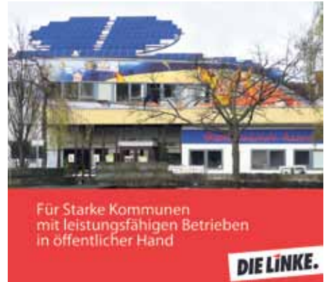
Eine Kernforderung der Linken

keinen Sinn, Kohlekraftwerke zu errichten, die noch mehrere Jahrzehnte in Betrieb bleiben. Sinn macht es allerdings, alte Kraftwerke den privaten Großkonzernen zu entziehen und