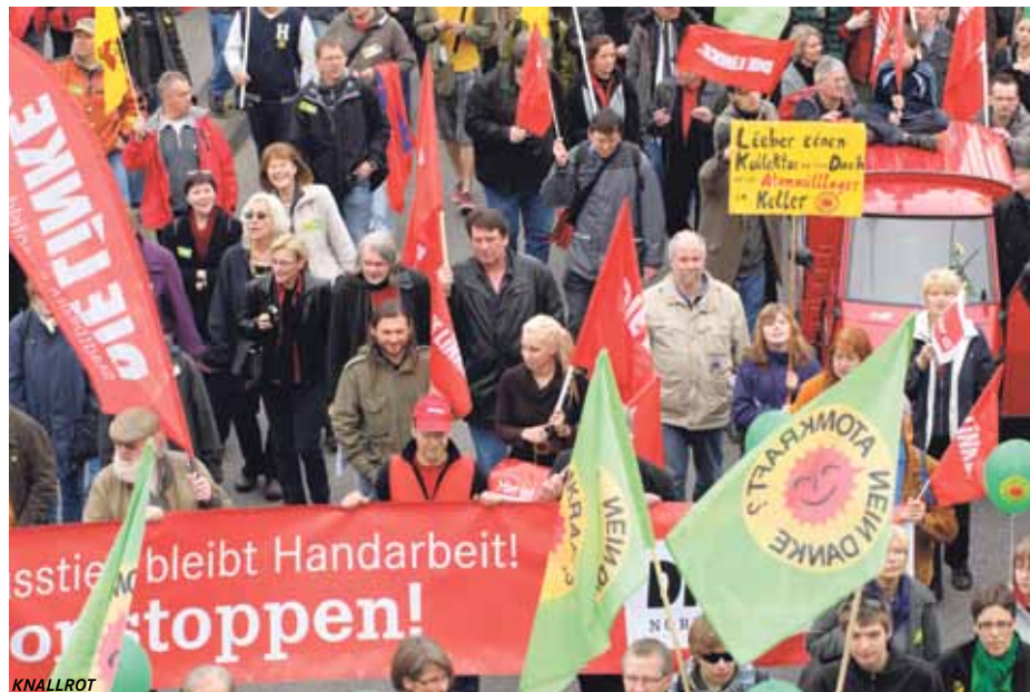
Anti-Atomkraft Demonstration in Köln am 26. März 2011

Dass Atomtransporte nicht sicher sind, machen vor allem zwei Vorfälle beispielhaft deutlich: Am 8. März 2010 wurde auf der Autobahn A1 ein LKW mit Uranhexafluorid auf dem Weg zur Urananreicherungsanlage Gronau von der Polizei gestoppt, weil die tragenden Teile durchgerostet waren. Im Januar 2010 kam es in der UAA Gronau zu einem Unfall, bei dem Mitarbeiter durch eine Undichtigkeit eines Transportcontainers verätzt und radioaktiv verstrahlt wurden. Zum Glück fand dieser Vorfall nicht auf der B1 mitten im Berufsverkehr statt. Im Wissen um die Abhängigkeit der Urananlagen von Atomtransporten