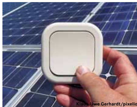
Zukunft ohne Atomstrom und RWE

Doch der Gesellschaftsvertrag der DEW21 mit RWE läuft Ende 2014 aus.