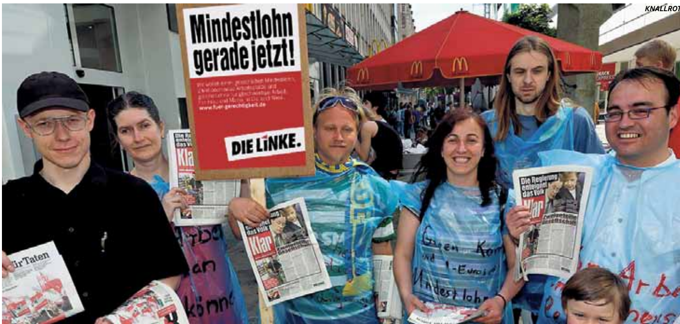
DIE LINKE. Dortmund fordert den Mindestlohn

Die GRÜNEN gewinnen, die anderen verlieren Wahlen - auch DIE LINKE. Der Sieg der GRÜNEN ist die Antwort eines gut situierten Mittelstandes auf die Folgen der Klima- und Wirtschaftskrise. Die Antwort der prekär Beschäftigten und Erwerbslosen steht noch aus. Der grüne Erfolg wird ohne soziale Proteste zu einem ökologischen Umbau auf dem Rücken der Lohnabhängigen führen. Öko für die Reichen - Lohn- und Sozialabbau für viele. Dagegen braucht es Protest: in den Betrieben und den Stadtteilen. Im Landtag können wir mit 5,6 Prozent nur wenig ändern, aber die anderen Parteien stören. Für eine bessere Politik müssen wir mehr werden. Bis dahin werden wir darum kämpfen, dass sich der Protest gegen die Ausbeutung der Natur mit dem Protest gegen die Ausbeutung des Menschen verbindet. (ks)