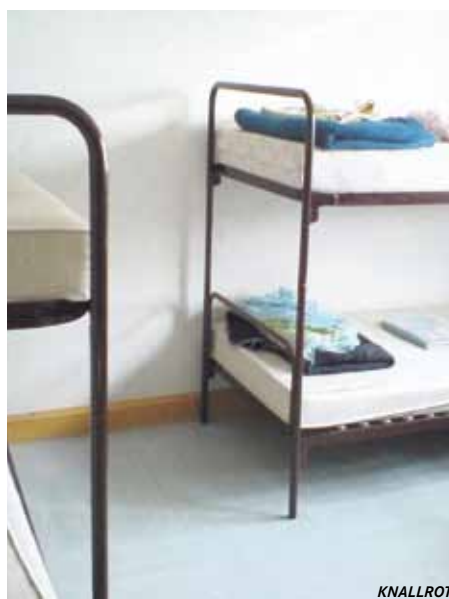
Notunterkunft in Dortmund-Hacheney

In Hacheney kommen sie in eine Wohlstandsgesellschaft, die sie aber nicht wirklich betreten dürfen. Denn