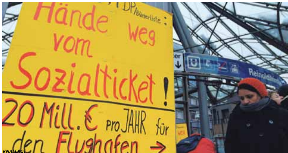
Dortmunder BürgerInnen demonstrieren für das Sozieticket

Im Gespräch ist jetzt ein verbilligtes 4er - Ticket, völlig unzulänglich für einkommensschwache Menschen. Aus diesem Grund haben sich alte