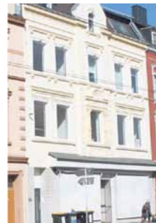
Rheinische Str. 135

Vollmundig gab sie gleichzeitig an, das Gebäude genau zu beobachten und zu prüfen, ob sich Gründe