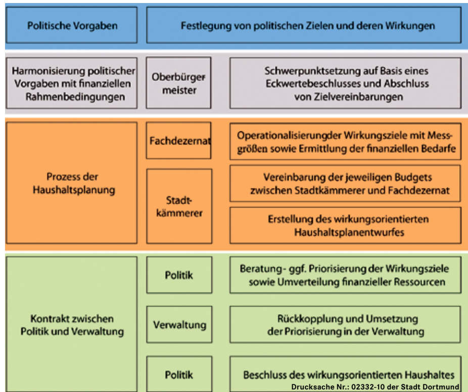
Das Konzept des „Wirkungsorientierten Haushaltes“

Überhaupt geht der dem Rat vorgelegte Verwaltungsantrag über eine Sammlung von Leerformeln und vagen Absichtserklärungen kaum hinaus. Aber dort wo er mal konkret wird, münzt er den wirkungsorientierten Haushalt im Klartext „zur kurzfristigen wirkungsorientierten Haushaltskonsolidierung“ um. Da lässt man die Katze aus dem Sack – das ganze dient zur Vorbereitung weiterer Rotstifttrunden. Unsere Ratsfraktion lehnt diese Moggelpackung selbstverständlich ab. Allerdings nicht ohne den Versuch, sie mit Änderungsanträgen bürgernäher und sozialer zu machen (ws)