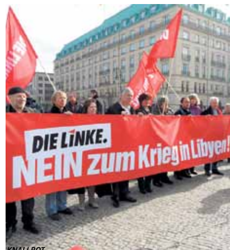
Kundgebung in Berlin- am 20. März 2011

Um Menschenrechte geht es dabei nicht. Noch im Januar hat Frankreichs Staatspräsident Nicolas Sarkozy den mittlerweile gestürzten tunesischen Diktator gegen sein Volk unterstützen